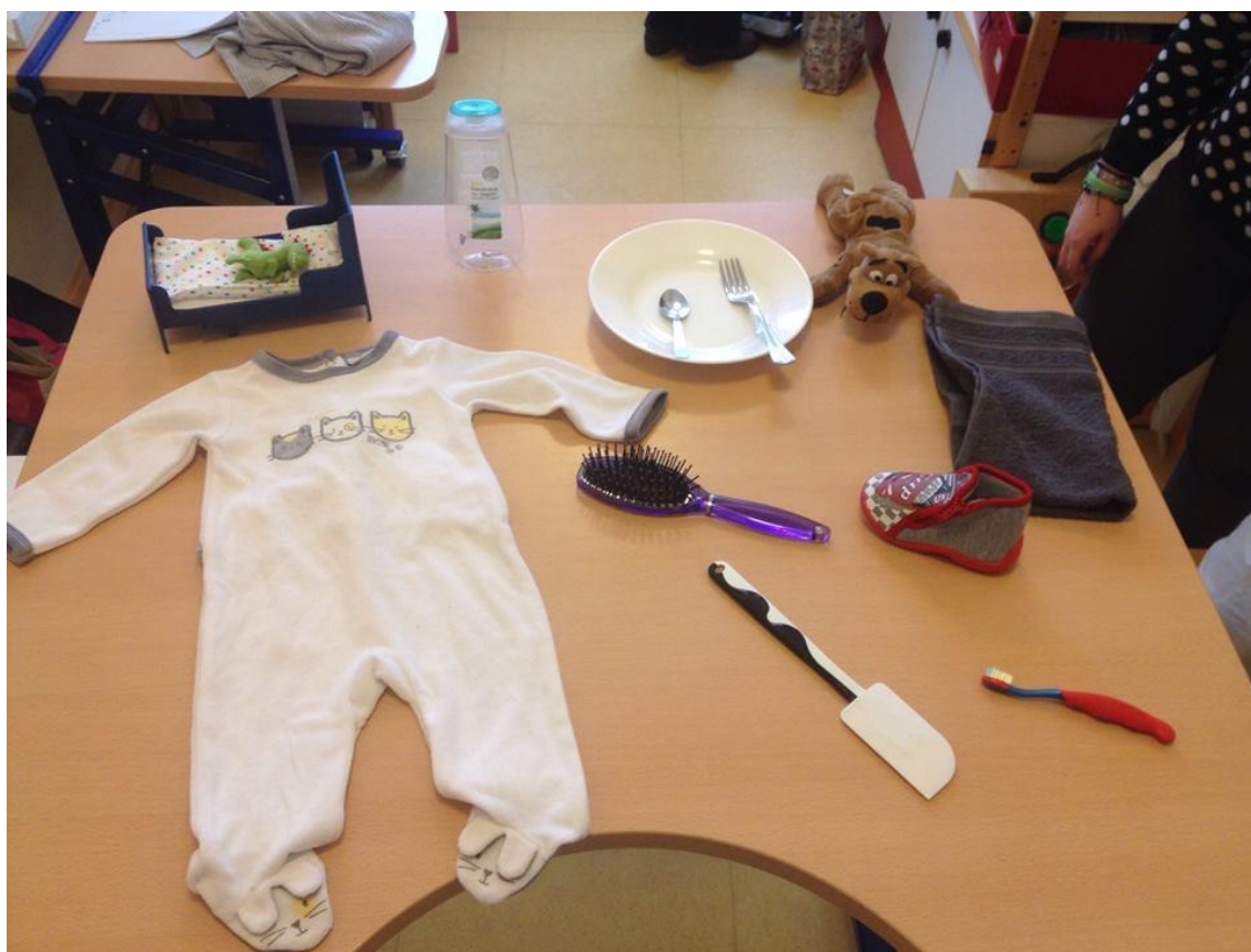
Figure 2 Objets du quotidien du Jeu 1