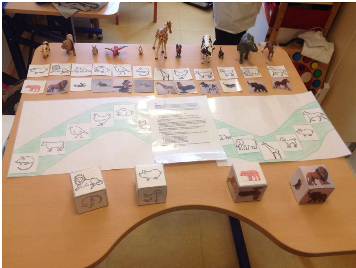
Figure 3 Jeu 2 complet