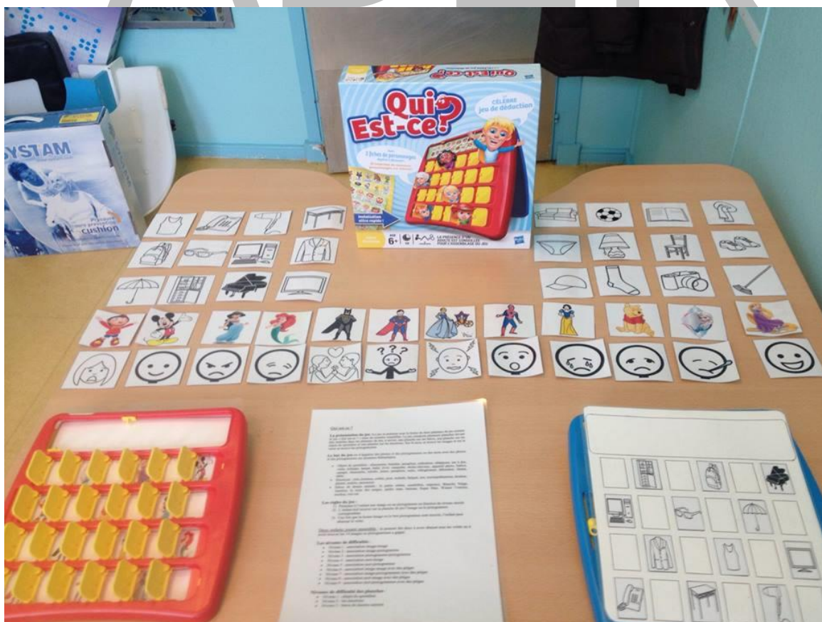
Figure 4 Jeu 3 complet